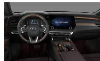
Тёмная сепия (Luxury)