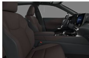
Тёмная сепия (Premium)