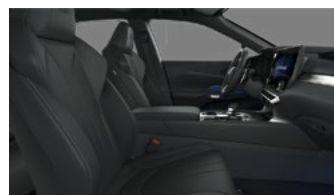
Чёрный F Sport

Список комплектации представляет собой подборку наиболее важных параметров. Компания «Continental» оставляет за собой право изменять эту брошюру в результате ошибок, структурных изменений или сообщений от производителя без предварительного уведомления. Гарантия на автомобили Lexus: 3 года или 100 000 км пробега. Расход топлива и выбросы CO 2 автомобиля зависят не только от его энергоэффективности, но также от стиля вождения и других факторов не технического характера. Углекислый газ (CO 2 ) является основным парниковым газом, ответственным за глобальное потепление. Брошюра действительна до выпуска обновленного издания.