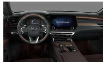
Тёмная сепия (Luxury)