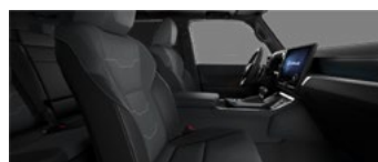
Тёмно-серый с чёрными акцентами (LA10/11)*