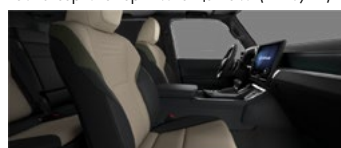
Песочный с чёрными и оливковыми акцентами (LC12/13)*