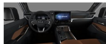
Коричневый с чёрными акцентами (LA41)*

Список комплектации представляет собой подборку наиболее важных параметров. Компания «Continent» оставляет за собой право изменять эту брошюру в результате ошибок, структурных изменений или сообщений от производителя без предварительного уведомления. Гарантия на автомобили Lexus: 3 года или 100 000 км пробега. Расход топлива и выбросы CO 2 автомобиля зависят не только от его энергоэффективности, но также от стиля вождения и других факторов не технического характера. Углекислый газ (CO 2 ) является основным парниковым газом, ответственным за глобальное потепление. Брошюра действительна до выпуска обновленного издания.