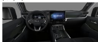
Чёрный с оливковыми акцентами (LC20)*