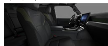
Чёрный с оливковыми акцентами (LC20/21)*